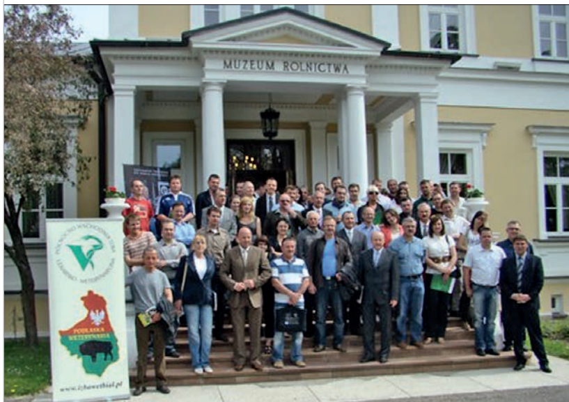
Konferencja Bujatryczna w Ciechanowcu

Dzień otwarcia nowej siedziby Izby był niewątpliwie bardzo ważnym wydarzeniem w życiu naszego samorządu weterynaryjnego.