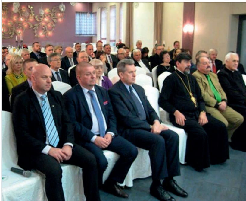
Spotkanie oplatkowe w 2015 r.