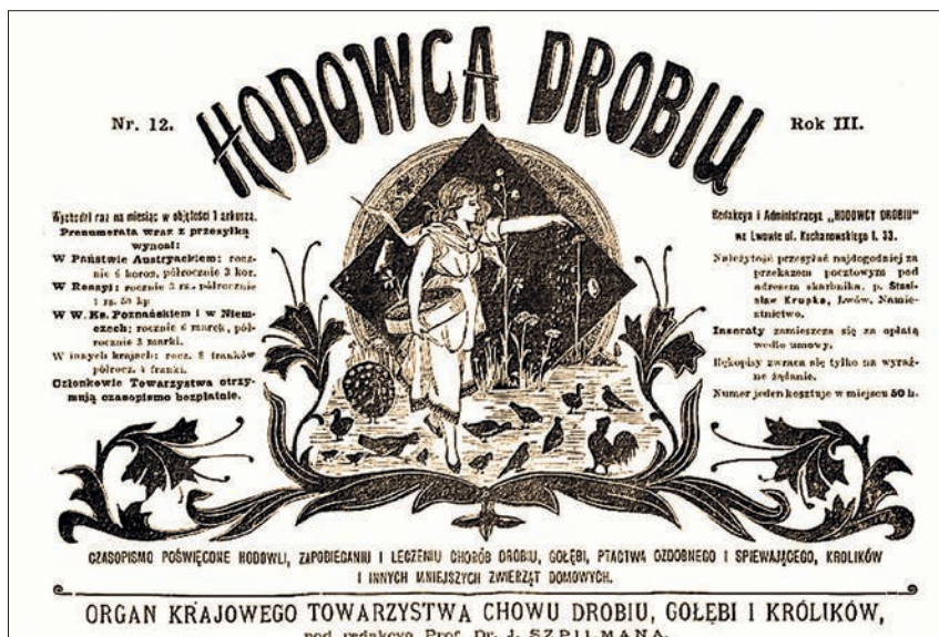
Ryc. 5. Winieta czasopisma „Hodowca Drobiu”