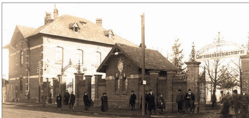
Ryc. 6. Rzeźnia Miejska we Lwowie