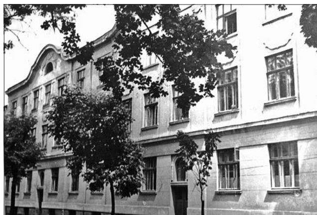
Ryc. 3. Budynek Instytutu Bakteriologicznego przy ul. Kochanowskiego