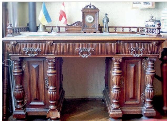
Ryc. 8. Biurko prof. Józefa Szpilmana w muzeum lwowskiej uczelni