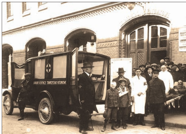
Ryc. 7. Stacja pogotowia ratunkowego we Lwowie