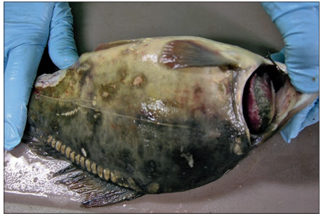
Ryc. 3. Zakażenie wirusem herpes karpia koi u dwuletniego karpia; ogniska martwicy skóry, martwica skrzeli