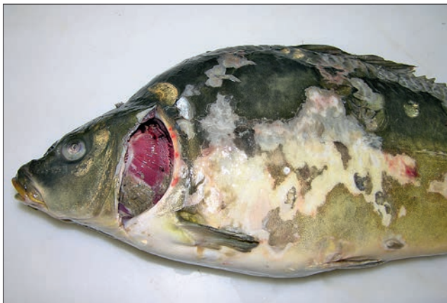
Ryc. 4. Zakażenie wirusem herpes karpia koi u trzyletniego karpia; martwica i złuszczenie się naskórka, martwica około 30% tkanki skrzelowej