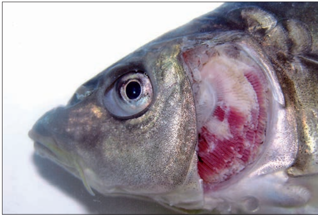
Ryc. 2. Zakażenie wirusem herpes karpia koi u dwuletniego karpia, martwica około 50% tkanki skrzelowej