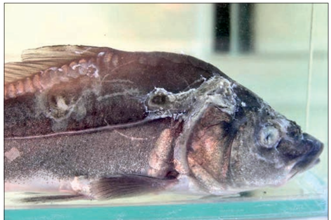
Ryc. 5. Eksperymentalne zakażenie wirusem herpes karpia koi u karpia, rozległa martwica naskórka i skóry oraz rogówki oka

określonym herpeswirusem a swoistym dla niego gospodarzem (4). Istnienie zjawiska wzajemnej adaptacji potwierdzono w wielu molekularnych badaniach filogenetycznych, jak również w tym, że w większości przypadków herpeswirusy wykazują umiarkowaną patogenność wobec gospodarzy. Powszechnie uważa się, że ostre postaci choroby o etiologii herpeswirusowej pojawiają się jedynie wówczas, gdy dojdzie do znacznego osłabienia układu odpornościowego gospodarza lub gdy zakażenie wystąpi u nowego, ale wrażliwego gospodarza (5). Do najbardziej znanych chorób ryb wywoływanych przez herpeswirusy należą: herpeswirusowa choroba łososia wywoływana przez wirus SalHV-1, herpeswirusowa choroba jesiotrów wywoływana przez wirus AcHV-1, herpeswirusowa choroba sumików wywoływana przez wirus IchV-1, ospa karpia wywoływana przez wirus CyHV-1, martwica układu krwiotwórczego karasi wywoływana przez wirus CyHV-2, zakażenie wirusem herpes karpia koi wywoływane przez wirus CyHV-3 oraz herpeswirusowa choroba węgorzy wywoływana przez wirus AqHV-1. Porównanie genotypów różnych szczepów CyHV-1, CyHV-2 i CyHV-3, zaliczanych do herpeswirusów ryb karpiojących, wykazało, że