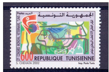
Ryc. 5. 27. Światowy Kongres Weterynaryjny, Tunis, Tunezja, 2002