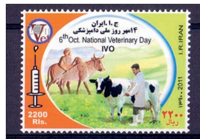
Ryc. 2. Narodowy Dzień Weterynarii/Światowy Rok Weterynarii, Iran, 2011

Dzikich Zwierząt w Lizbonie. Instytucja ta powstała w 1997 r. jako miejsce, do którego mogą trafiać osłabione bądź ranne zwierzęta z okolic stolicy kraju (3). Znaczki z tej okazji wypuściły także poczty: Togo oraz Iranu. Znaczek irański, na którym zestawiono starożytnego opiekuna bydła i współczesnego lekarza, upamiętnia także Narodowy Dzień Weterynarii (ryc. 2).