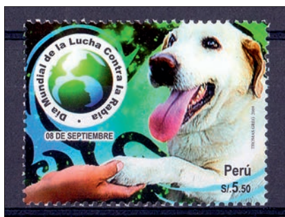
Ryc. 11. Światowy Dzień Wściekliczyny, Peru, 2009