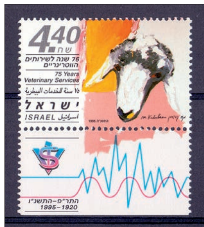
Ryc. 1. 75 lat służb weterynaryjnych, Izrael, 1995

Przypadający na 2011 r. Światowy Rok Weterynarii został odnotowany przez kilka krajowych poczt. Francja wydała okolicznościowy znaczek upamiętniający 250. rocznicę powołania do życia pierwszej szkoły weterynaryjnej. Widnieje na nim portret Claude'a Bourgelat – założyciela szkół weterynaryjnych w Lyonie i Alfort (2). Poczta Portugalii upamiętniła Światowy Rok Weterynarii wydaniem niezwykle barwnej czteroznaczkowej serii oraz bloku. Poszczególne znaczki odnoszą się do rozmaitych aspektów: ochrony zdrowia zwierząt, doskonalenia ras, produkcji leków dla zwierząt oraz ochrony zdrowia publicznego. Blok zaś dodatkowo poświęcony jest Centrum Rehabilitacji