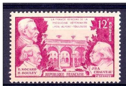
Ryc. 4. Francja kolebką medycyny weterynaryjnej, Francja, 1951