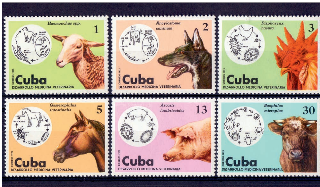
Ryc. 13. Seria znaczków – Rozwój medycyny weterynaryjnej, Kuba, 1975

W 2000 r. zainicjowano kolejną panafrykańską kampanię, tym razem skierowaną przeciwko muszce tse-tse i przenoszonym przez nią trypanosomatozom ludzi i zwierząt. Zwalczanie nagany u zwierząt i śpiączki afrykańskiej u ludzi propagowane jest m. in. na seriach znaczków pocztowych wyemitowanych w Etiopii (2009; ryc. 9), Ugandzie (2011) i Malawi (2012; 37).