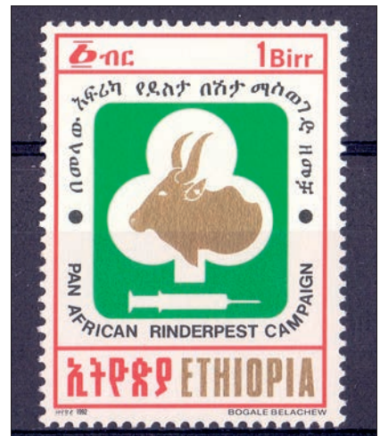
Ryc. 10. Znaczek z serii – Panafrykańska Kampania Przeciwwksięgosuszowa, Etiopia, 1992

w setną rocznicę śmierci. Poczta Polska wypuściła znaczek z jego podobizną w 1959 r. W tym wypadku także trudno doszukać się połączenia Pasteura z weterynarią. Poczty Mozambiku i Gwinei-Bissau umieściły na znaczkach jemu poświęconych także i psy.