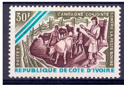
Ryc. 9. Wspólna kampania przeciw księgosuszowi, Wybrzeże Kości Słoniowej, 1967

w 1935 r. Za jego kadencji powstał w mieście szereg instytucji i obiektów m.in. pierwszy w zachodniej Francji sportowy basen. W czasie II wojny światowej został ze względów rasistowskich usunięty przez Niemców z urzędu. Podjął pełnoetatową pracę jako lekarz weterynarii. Będąc członkiem ruchu oporu, został aresztowany i uwięziony. Zmarł w obozie koncentracyjnym w Buchenwaldzie na skutek ran odniesionych w czasie bombardowania fabryki przez aliantów. Po zakończeniu wojny plac przed ratuszem w Sable-sur-Sarthe został nazwany jego imieniem (34).