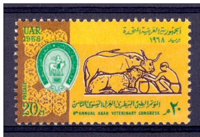
Ryc. 6. 8. Arabski Kongres Weterynaryjny, Egipt, 1968

Na wydanym w 2010 r. znaczku upamiętniającym stulecie Instytutu im. Friedricha Loefflera umieszczono portret założyciela tej instytucji. Friedrich August Johannes