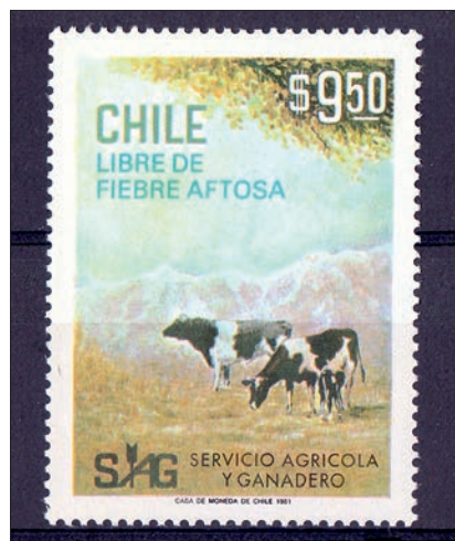
Ryc. 12. Chile wolne od pryszczycy, Chile, 1981

Podobnie licznie prezentowany bywa na znaczkach Ludwik Pasteur, najczęściej