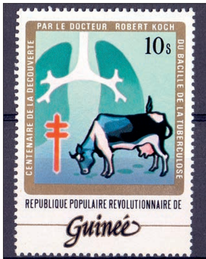
Ryc. 8. Znaczek z serii – Setna rocznica odkrycia przez dr Roberta Kocha prątkę gruźlicy, Gwinea, 1982

Loeffler (1852–1915) – niemiecki bakteriolog, profesor Uniwersytetu w Greifswaldzie, zasłużył się weterynarii swoimi badaniami nad pryszczycą (7).