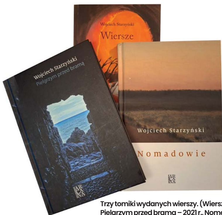
Trzy tomiki wydanych wierszy. (Wiersze – 2019 r.; Pielgrzym przed bramą – 2021 r., Nomadowie – 2024 r.).

Dziękuję za tę niezwykle osobistą rozmowę. ●