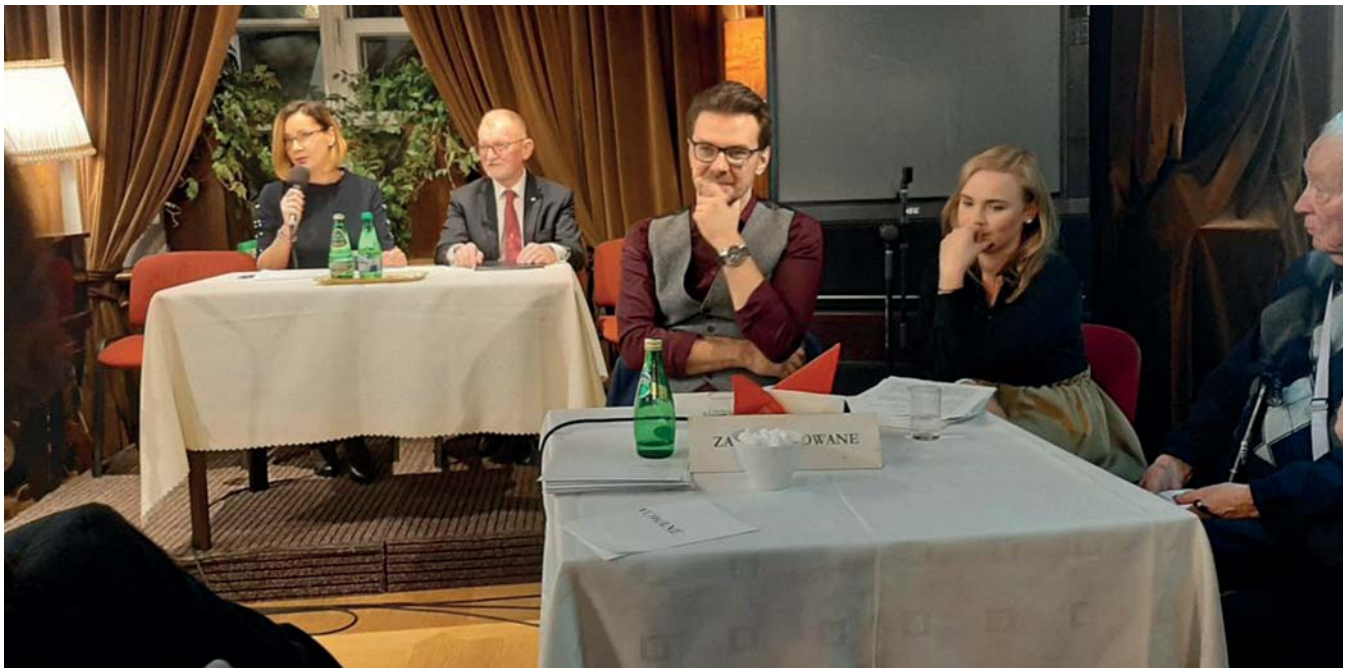
Wieczór autorski w warszawskim Klubie Księgarza (2019 r.).

odeszli, i o sensie walki, ale również o sprawach intymnych (o miłości) oraz o tajemniczości i pięknie otaczającego nas świata.