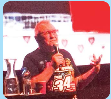
Jurek Owsiak podczas Ceremonii Otwarcia.