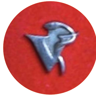
Przeznaczony do „noszenia w klapie” znaczek lekarza weterynarii.

Ponadto wypisywaliśmy i wkładali, w identycznego koloru skórzane okładki, z wyciśniętym logo specjalisty, drugie w formacie A4 dyplomy i legitymacje. Jaka była to praca, należało ozdobnym piśmem wypisać wszystkie dyplomy i legitymacje, sprawdzić czy nie popełniono błędów, posortować to alfabetycznie nazwiskami specjalistów, popakować w kartony, przewieźć do Warszawy i zorgani-