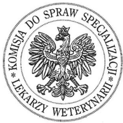
Oficjalna okrągła wyciskana pieczęć Komisji ds. Specjalizacji.

Prewencja weterynaryjna i higiena pasz, Higiena zwierząt rzeźnych i żywności pochodzenia zwierzęcego, Weterynaryjna diagnostyka laboratoryjna, Epizootiologia i administracja weterynaryjna). Pozostałych 8 specjalizacji z różnorodnych przyczyn, nadal pozostawało nieaktywnymi. Całość prac Komisji pierwszej kadencji syntetycznie zobrazowana jest na 148 stronach, zatwierdzonych stosownymi uchwałami, „oficjalnych protokołów” z jej 15 posiedzeń.