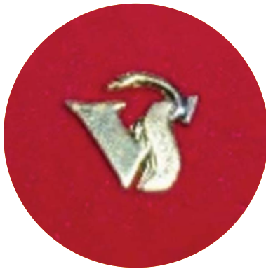
Przeznaczony do „noszenia w klapie” znaczek specjalisty zawodowego.